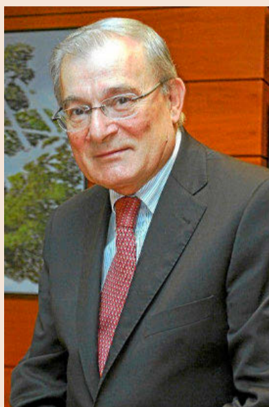
Manuel Azuaga, presidente de Unicaja Banco.