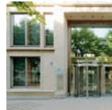
Karl-Scharnagl-Ring 5 80539 München

Zudem gehört zu unserem Münchner Büro das Legal Service Center in Berlin. Von dort unterstützen und erweitern die Kolleg*innen vor Ort den Münchner Standort.