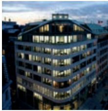
Alstertor 21 20095 Hamburg