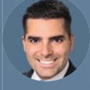
Dr. Sebastian Polly Hogan Lovells